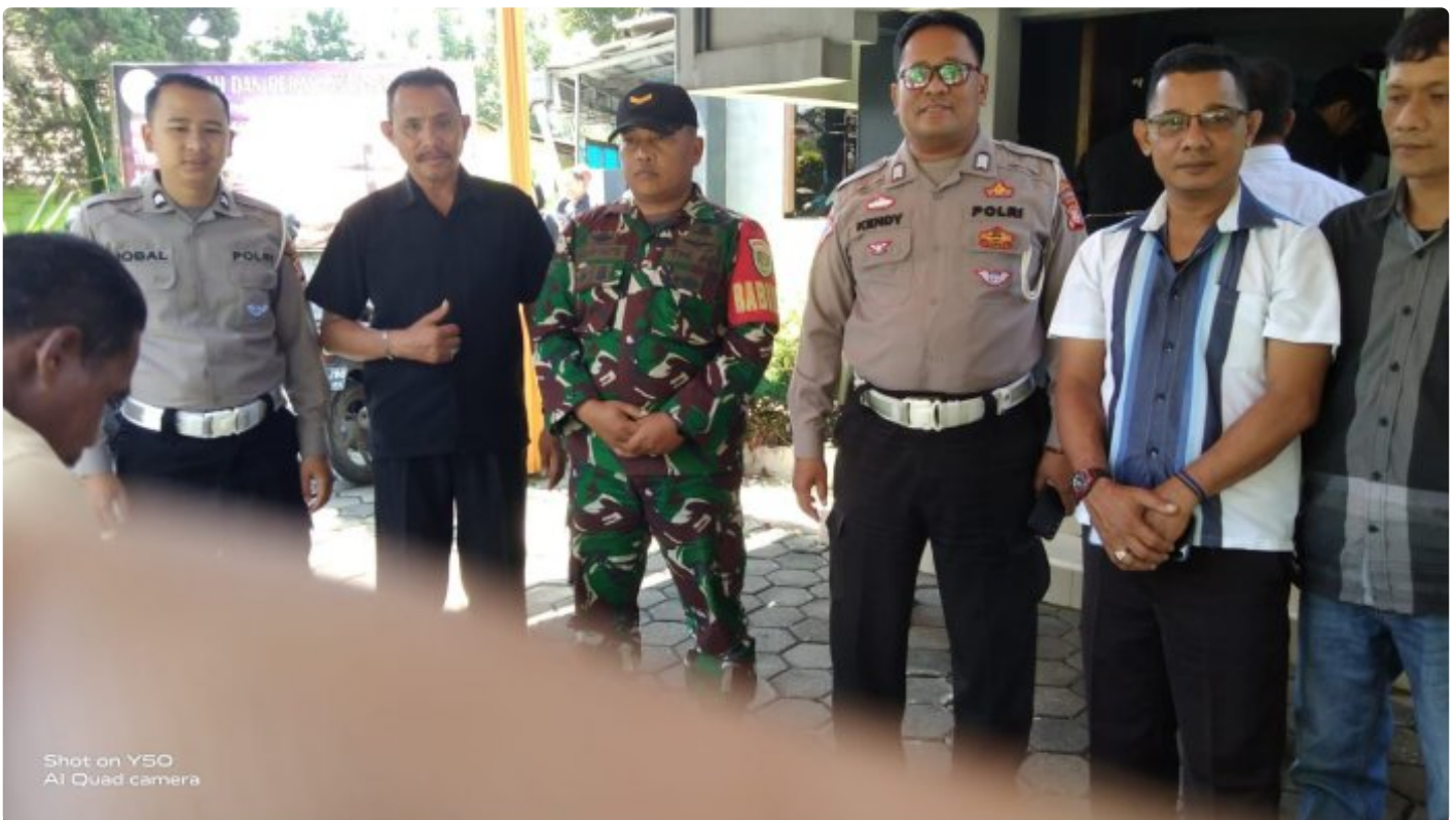
TNI dan Polri Lakukan Pengamanan Ibadah Jumat Agung, jumat 29 maret 2024

DAYEUKOLOT - Personel Polsek Dayeuhkolot bersama personil TNI dari koramil 2407 melakukan pengamanan DI gereja GPIB PNIEL YUDHA WYOGRHA di wilayah Kecamatan Dayeuhkolot, dalam rangka ibadah Jumat Agung, Jumat (29/3/2024)